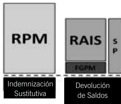
Figura 1. El Sistema General de Pensiones Actual

de pensión mínima a aquellas personas que alcanzan la edad de pensión, cuentan con 1150 semanas de cotización y no lograron acumular el capital mínimo para pensionarse, como lo es el Fondo de Garantía de Pensión Mínima (FGPM).