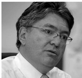
Mauricio Cárdenas Santamaría Ministro de Hacienda y Crédito Público