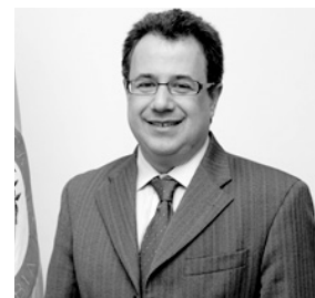
Mauricio Santa María Salamanca Director Departamento Nacional de Planeación

Consolidándose como protagonista del escenario económico internacional, Colombia enfrenta los retos que trae consigo el desarrollo. Romper las tendencias que persisten a lo largo de su historia económica y que restringen un círculo virtuoso de crecimiento parece ser el siguiente paso para el país. Cambiar el rumbo de la economía requerirá de reformas estructurales en el aparato productivo del país, así como en las políticas públicas. El contexto no podría ser más adecuado: importantes ingresos provenientes de recursos naturales, gran confianza externa depositada en Colombia jalonando inversión privada nacional y extranjera, puertas abiertas para un proceso de paz y una institucionalidad sólida. Esperamos que los panelistas nos den luces sobre el rumbo que tomará la economía colombiana y éstos recibirán los valiosos comentarios del doctor Guillermo Perry, experto economista que con su vasta experiencia seguramente pondrá sobre la mesa los puntos más relevantes y debatibles de la discusión.