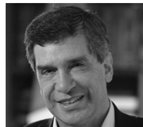
Rafael Pardo Ministro del Trabajo

Hoy, aproximadamente 10 millones de colombianos se encuentran afiliados al RAIS, sin embargo sólo hay cerca de 50 mil pensionados en este régimen. Las modalidades de pensión bajo las que están pensionados son el retiro programado (20 mil pensionados) y la renta vitalicia (30 mil pensionados). En los últimos años se ha visto un decrecimiento en el número de rentas vitalicias de vejez que obedece a un entorno complicado y riesgoso (riesgo derivado del incremento del SMLMV, tasa de interés de largo plazo decreciente, imposibilidad de calzar los activos y los pasivos, cambios de condiciones de beneficiarios, entre otros), el retiro programado por su parte, no es una opción para aquellos pensionados con pensiones cercanas al SMLMV (cerca del 65% de los pensionados). ¿Cuál es el futuro de la etapa de desacumulación del RAIS? ¿Qué mecanismos está contemplando el Gobierno frente a la sostenibilidad del RAIS?