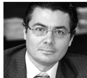
Alejandro Gaviria Ministro de Salud y Protección Social

Por su parte, la Escuela de Gobierno de la Universidad de Los Andes en cabeza de su director, Carlos Caballero, presentará la visión contenida en su publicación “La Salud en Colombia: Logros, Retos y Recomendaciones”, y tendrá la oportunidad de discutir las ventajas y desventajas de la competencia en la prestación de servicios de salud, el impacto de la inestabilidad jurídica sobre el sistema, entre otros.