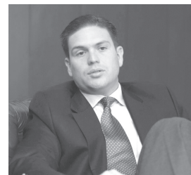
Juan Carlos Pinzón Ministro de Defensa Nacional

Los planteamientos sobre Seguridad Nacional por parte del Ministro de Defensa Nacional, Juan Carlos Pinzón, son el tema del Acto de Clausura de la Convención. El Ministro se referirá a los temas relacionados con la estrategia general de seguridad, así como datos generales de lo que viene sucediendo con los actos terroristas en la geografía nacional, en particular su frecuencia y severidad, y los resultados en los encuentros con las FARC y el ELN, así como con las BACRIM (Bandas Criminales Emergentes).