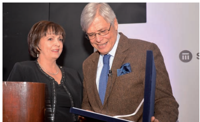
El homenaje de los reaseguradores se llevó a cabo el pasado 15 de septiembre en el Gun Club de Bogotá.

Las oficinas de representación de los reaseguradores en el exterior que operan en Colombia, conmemoraron los 40 años del gremio. El encuentro se llevó a cabo el 15 de septiembre en el Gun Club de Bogotá, con el conversatorio “La contienda electoral de los Estados Unidos y los efectos del Brexit para América Latina”, que contó con la participación del exministro Fernando Cepeda Ulloa y el profesor Marc Hofsteter.