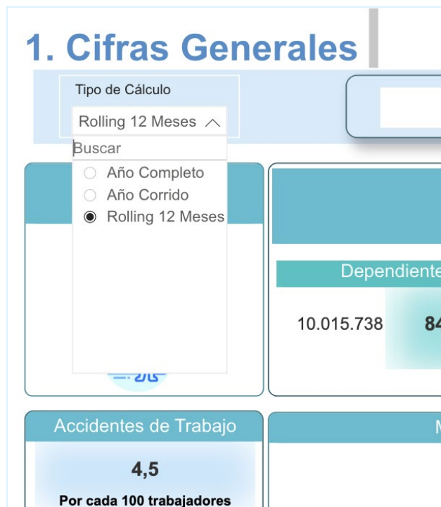
Imagen referencia del sistema RL Datos 2.0

los últimos 12 meses, que muestra los datos como una suma o promedio móvil, tomando como base la información del último año.